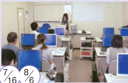
電子納品・電子入札担当者スキルアップ講習会